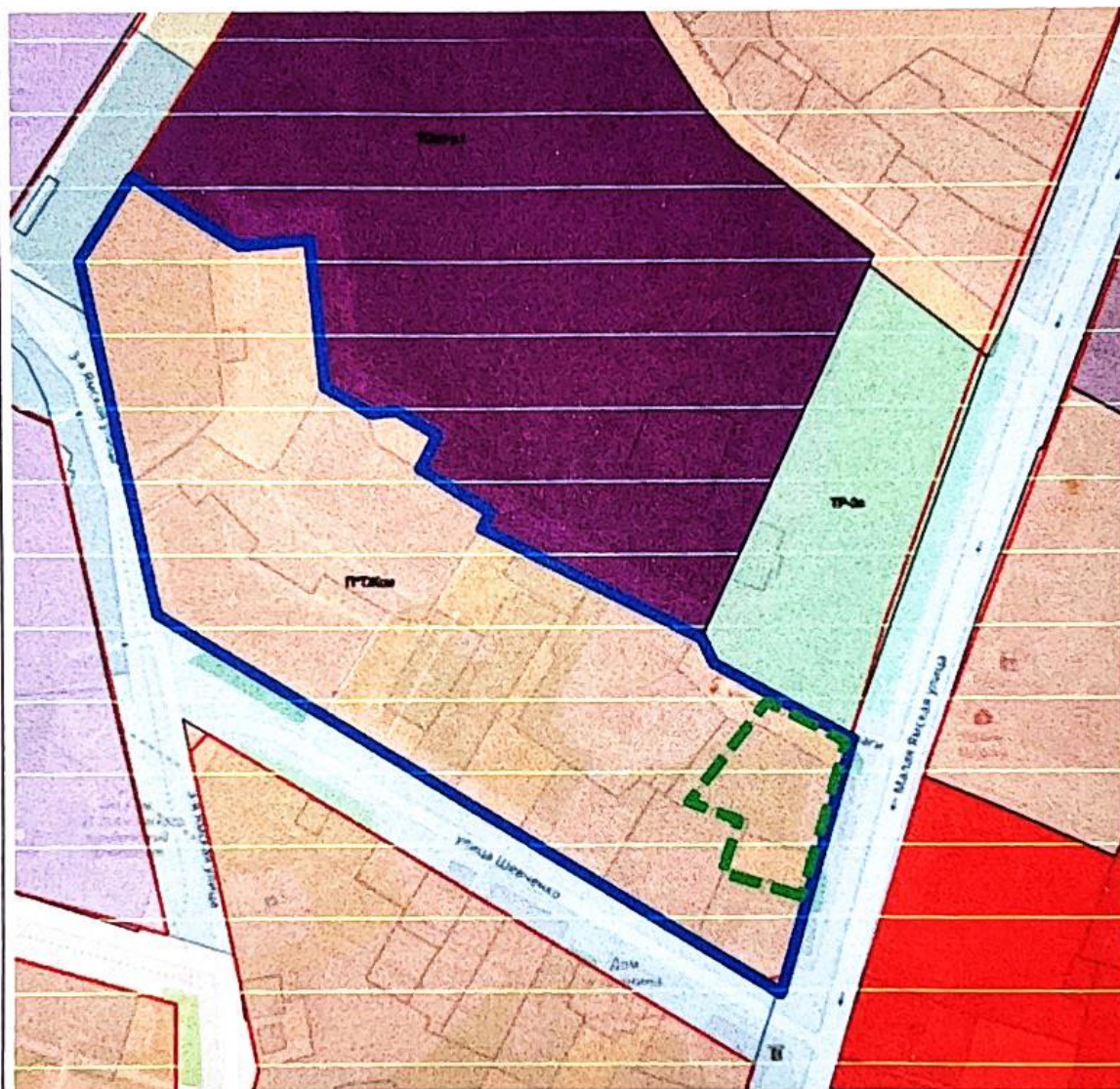
Схема с указанием границ подготовки документации по планировке территории